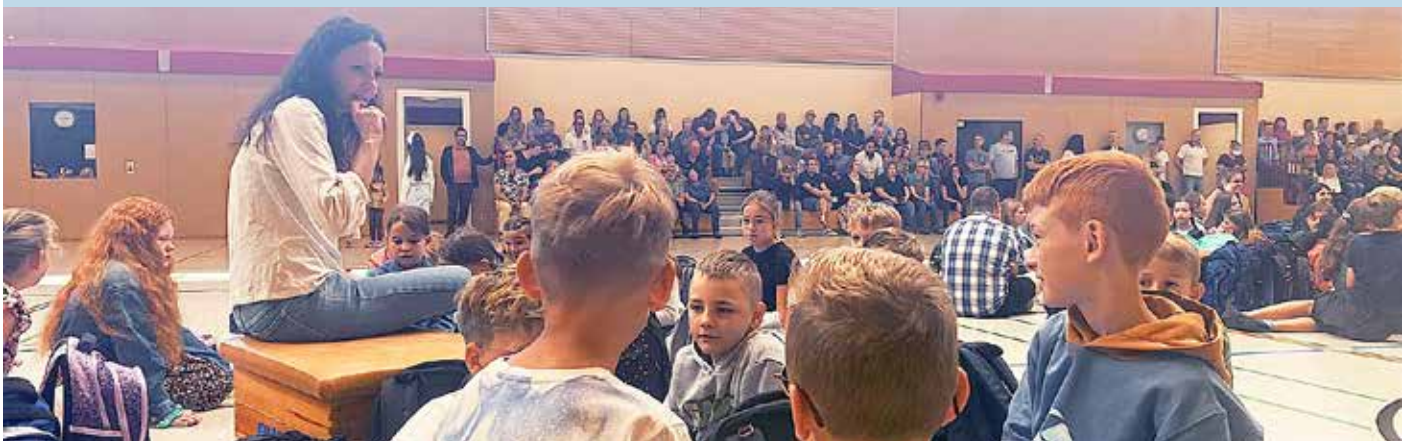
Begrüßung der neuen Fünftklässler am Reichswald-Gymnasium in Ramstein.