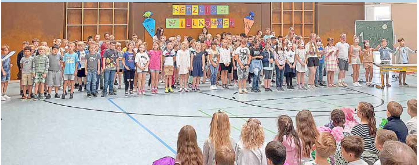
Begrüßung der Erstklässler in der Moorbachtal-Grundschule (Foto: Marcus Klein).

Als Träger für die Grundschulen in Hütchenhausen-Spesbach, Steinwenden und Ramstein-Miesebach, sowie der Realschule Plus in Ramstein ist die Verbandsgemeinde Ramstein-Miesebach stets darum bemüht, an ihren Schulen die besten Voraussetzungen für die Schülerinnen und Schüler zu schaffen, die von der hervorragenden Ausstattung der Schulen profitieren. Die Zahlen der neuen Erstklässler an den Grundschulen sowie der Fünftklässler an der Realschule Plus sind weiterhin hoch. Zum neuen Schuljahr begrüßt die Grundschule in Hütchenhausen-Spesbach 38 neue Schüler, die sich auf zwei Klassen aufteilen. Die Wendelinus-Grundschule in Ramstein bekommt 114 neue Schüler, welche auf fünf Klassen aufgeteilt werden und die Moorbachtal-Grundschule in Steinwenden darf sich auf 43 neue Schüler in ebenfalls zwei Klassen freuen. Auch das Reichswald-Gymnasium in Ramstein, das in Trägerschaft des Landkreises steht, erfreut sich weiterhin hoher Schülerzahlen. So gab es für das neue Schuljahr 2023/24 insgesamt 125 Neuzugänge, die sich auf fünf 5. Klassen verteilen. Sie wurden am ersten Schultag in der Sporthalle des Gymnasiums begrüßt. Unsere Bilder stammen vom ersten Schultag in der Moorbachtal-Grundschule in Steinwenden und am Reichswald-Gymnasium, wo die neuen Schüler freundlich begrüßt wurden.