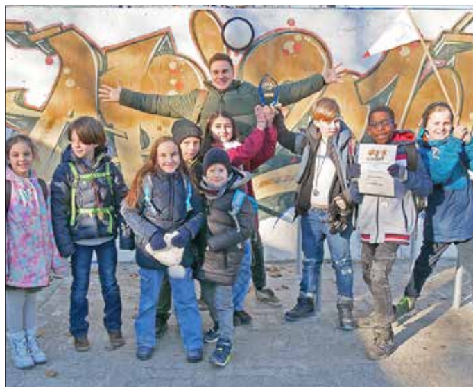
Beide Teams der Wendelinusschule freuten sich über den tollen Erfolg (Fotos: Wendelinusschule).

Bei den pfälzischen Schulschachmeisterschaften der Grundschulen wurde der Titel erstmals nach Ramstein-Miesenbach geholt. Mit dem Sieg hat sich das Team der Wendelinus-Grundschule für die rheinland-pfälzischen Schulschachmeisterschaften in Bitburg am 18. März qualifiziert.