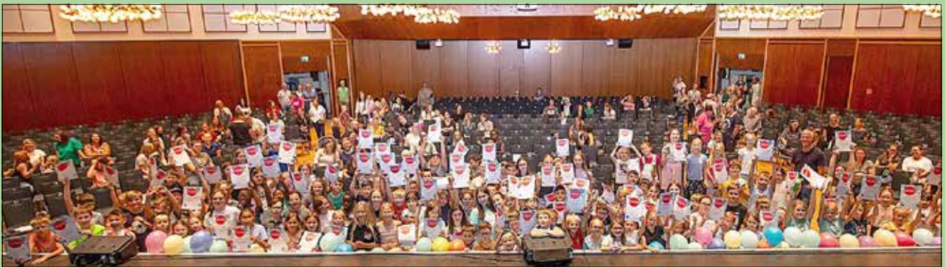
Großes Gruppenbild mit allen anwesenden Jungs und Mädchen.