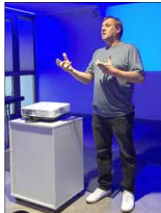
Betinho Klein bei der Filmpräsentation

Eine ganze Reihe Brasilieninteressierter und Brasilienfreunde fand sich am Mittwoch, 13. September, in der Lounge des Congress Centers Ramstein ein, um einer Filmpräsentation mit dem brasilianischen Schauspieler und Regisseur Carlos Alberto Klein zu folgen.