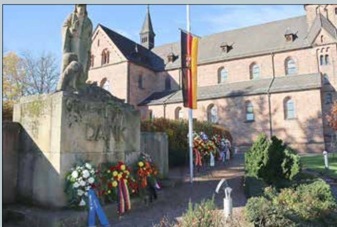
Das Ehrenmal an der katholischen Kirche in Ramstein. Eine von vielen Gedenkstätten für die Opfer der beiden Weltkriege in der Verbandsgemeinde.

Gedenkfeiern am Sonntag, 19. November 2023: