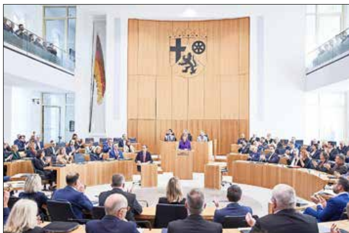
Der Landtag Rheinland-Pfalz gedachte der Opfer der Terrororganisation der Hamas mit einer Schweigeminute und bekundete seine Solidarität mit Israel.