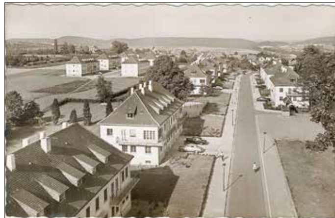
Blick auf die Fliegerstraße.