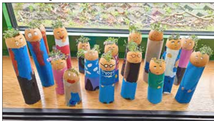
(Die Erdmännchen, Klasse 2d, Wendelinusschule)

Letztendlich wurde das kreative MINT-Projekt als Foto zum Eierschalenwettbewerb eingereicht und beeindruckte die Jury so, dass es als eines von drei Gewinnern ausgesucht wurde. Die Klasse erhielt als eine der Sieger des Wettbewerbes einen Gutschein in Höhe von 150 Euro Belohnung.