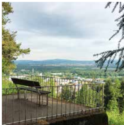
Am Herrengärtchen 3