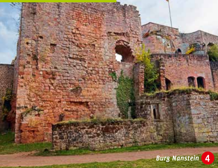
Burg Nanstein 4